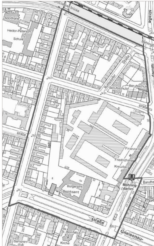
Abgrenzung des Untersuchungsgebietes (schwarze Linie)